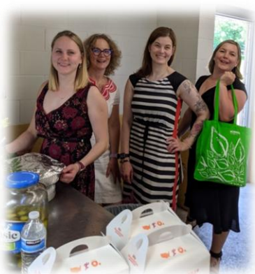
Daudzi pielika roku, lai izlaidums izdotos