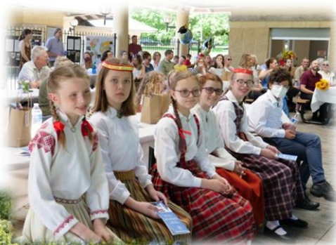
Nākamā absolventu klase