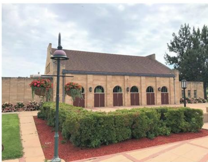
augšējā rindā: Misisipi upe, Harriet Island ir labajā krastmalā, Stokholmas Spējmani lejas rindā: Lini, Wigginton Pavilion

I esildīsim Dziesmu svētkus ar Zaļumballi St. Paulā uz Harriet Island, Misisipi upes krastmalā, ceturtdien, 30. jūnijā, 2022. g.!