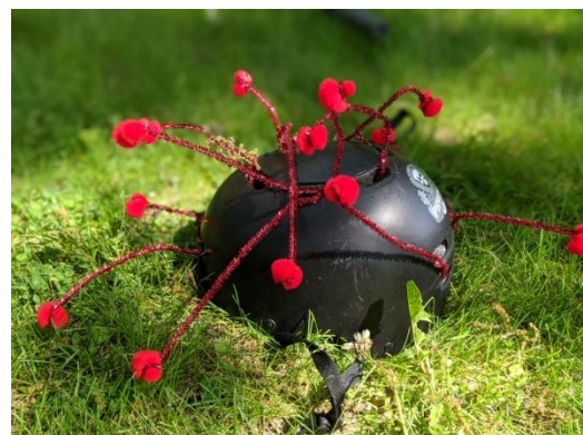
Kovids - skaists, bet labāk pa gabalu