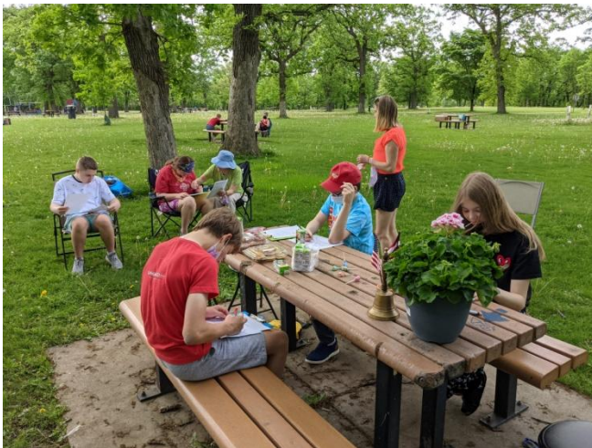
Topšie absolventi kārtro pārbaudījumus