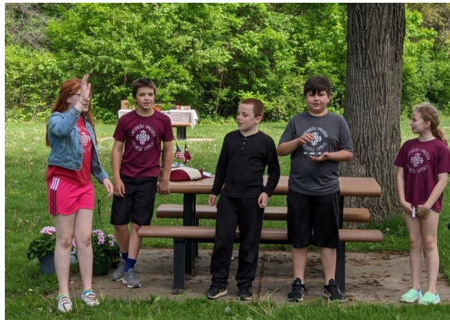
5. klase iztēlo V. Plūdoņa dzejoli