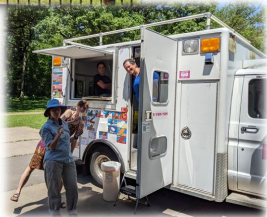
Karstajā laikā labi noderēja saldējuma ātrās palīdzības mašīna