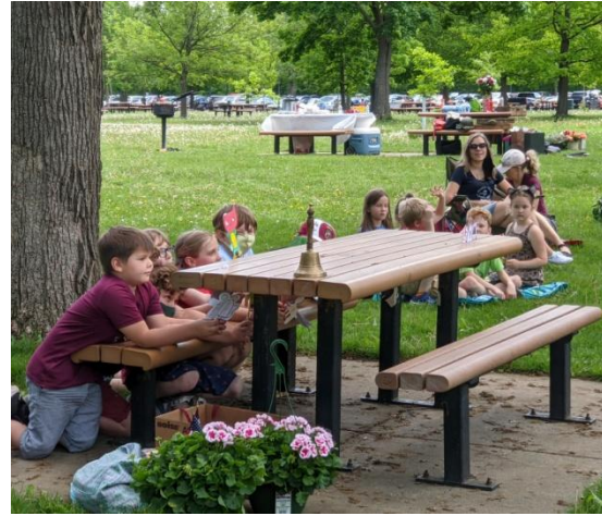
Ko dara 2. – 3. klase – spēlē leļļu teātri