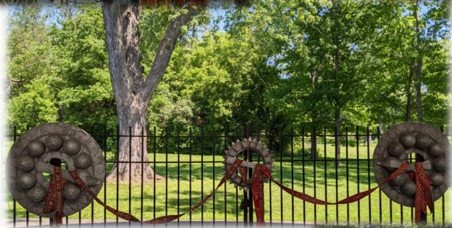
Indras Halvorsones un Māras Pelēces fotogrāfijas