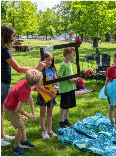
Pa kreisi bildē: sagatavošanās klase atceras Zoom lodziņu