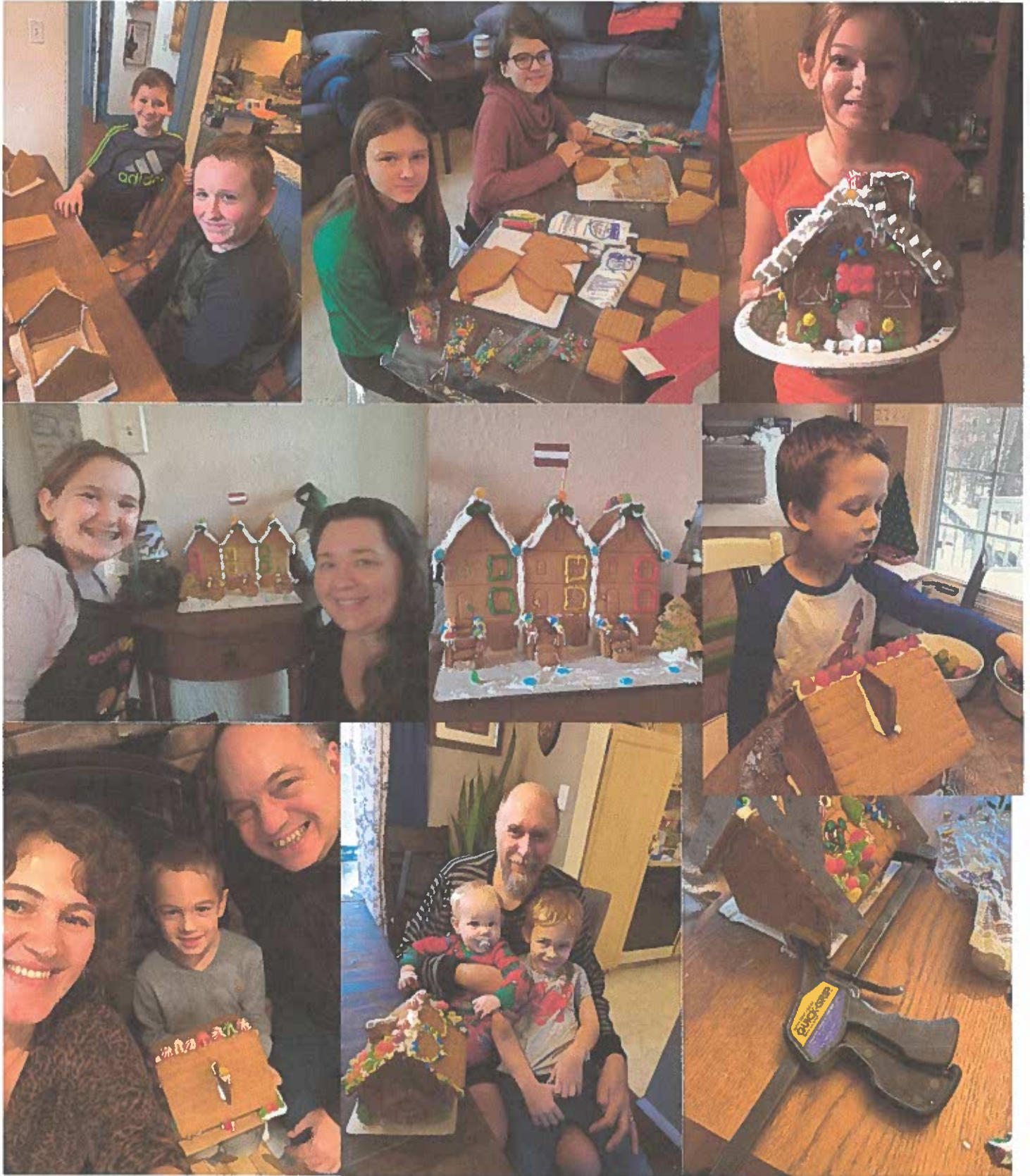
Šogad, par virtuālo Ziemassvētku Eglītes laiku, mēs būvējām Piparkūku mājiņas!