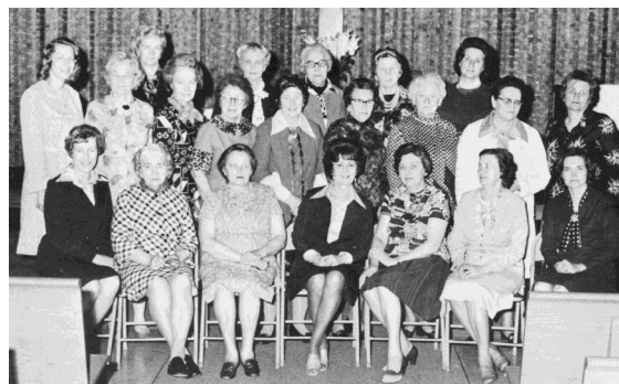
Sv. Jāņa draudzes Dāmu komiteja 1976. gadā

Pēc gandrīz 22 gadu Sv. Pāvila un Sv. Jāņa draudžu „kopdzīves” zem viena jumta, abas draudzes apvienojās un izvēlējās citu nosaukumu—Sv. Pēterā draudze. Šajā mājīgajā latviešu projektētajā un uzbūvētajā dievnamā kā Sv. Pēterā draudze jau satiekamies un Dievu lūdzam nedaudz vairāk nekā 24 gadus, gandrīz pusi no dievnama iesvētīšanas laika. Šajos gados mūs-