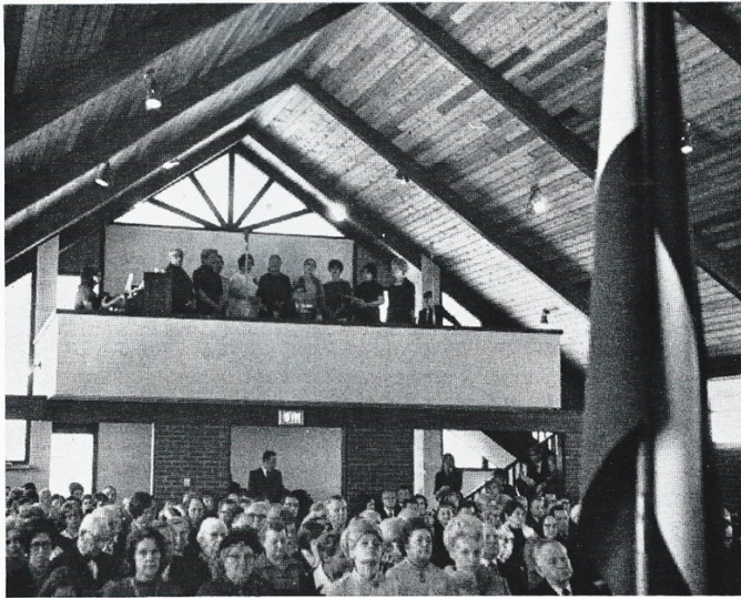
Iesvētīšanas dievkalpojuma draudze. Ar īpaši izvēlētām dziesmām piedalās Čikāgas Daugavas Vanadžu dubultkvartets.

Jaunā, 2021. gada sākumā, 17. janvārī mūsu draudze atzīmēja lielu un apaļu jubileju—dievnama iesvētīšanas piecdesmito gadadienu. Šajā reizē nedaudz atgādināšu dažus faktus, attiecībā uz šo notikumu, kurus daudzi no jums zina no savas pagātnes. Sv. Pāvila draudzes 25. gadadienas izdevumā ir rakstīts: „Sv. Pāvila draudzes pirmsākumi atrodami Senatobia pilsētā Misisipi štatā, kur 1949. gada 2. oktobrī no Vācijas bēgļu nometnēm ieradušies un kokvilnas plantācijās strādājošie tautieši nodibināja draudzi. Dažus gadus vēlāk, daudzi no šiem draudzes cilvēkiem, labāka darba meklējumos, nonāca Čikāgā, kur sanākuši kopā, nolēma atkal izveidot draudzi, lai Dieva vārdu dzirdētu latviešu valodā. Pirmais dievkalpojums notika 1954. gada 17. janvārī Meivudas luterāņu semināra kapelā.” Tātad 17. janvāris nav vienī-